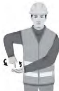
LASKE HITAASTI / LOWER DOWN SLOWLY