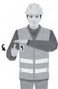
NOSTA HITAASTI / LIFT UP SLOWLY