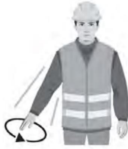
LASKE / LOWER DOWN