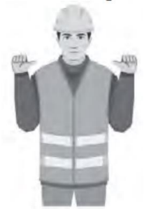
LYHENNÄ PUOMIA / SHORTEN BOOM