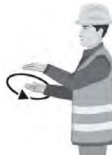
HITAASTI / SLOWLY