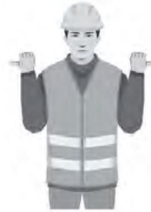
JATKA PUOMIA / EXTEND BOOM