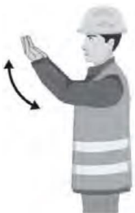
LIIKU ETEEN / MOVE FORWARD