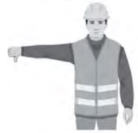
LASKE PUOMIA / LOWER BOOM