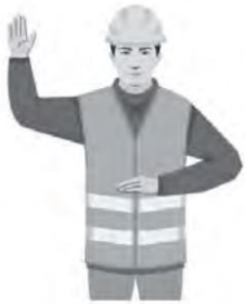
ALOITUS, HUOMIO / START, ATTENTION