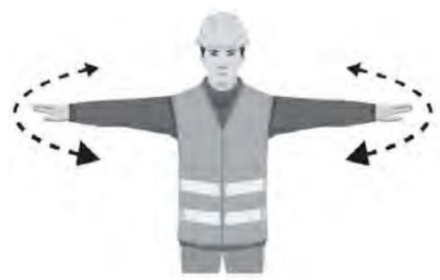
VAARA, SEIS / EMERGENCY STOP