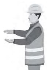
PYSTYETÄISYYS / VERTICAL DISTANCE