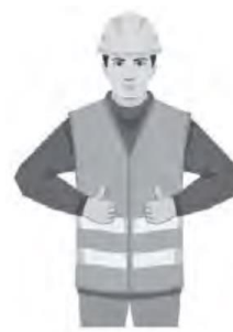
VAAKAETÄISYYS / HORIZONTAL DISTANCE