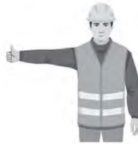
NOSTA PUOMIA / RAISE BOOM