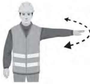
LOPETA TOIMINTO / STOP FUNCTION