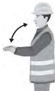
LIIKU TAAKSE / MOVE BACK